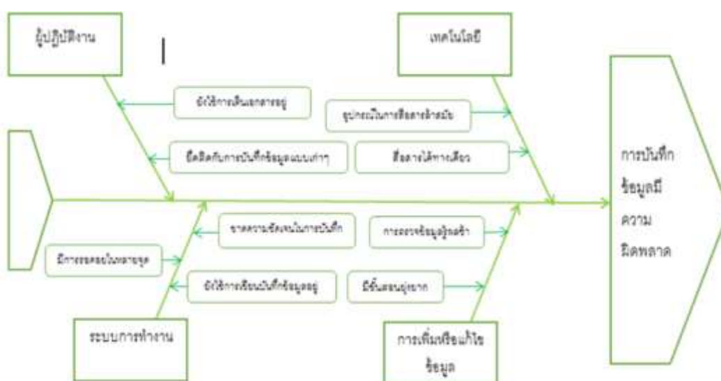
ภาพแผนผังก้างปลา